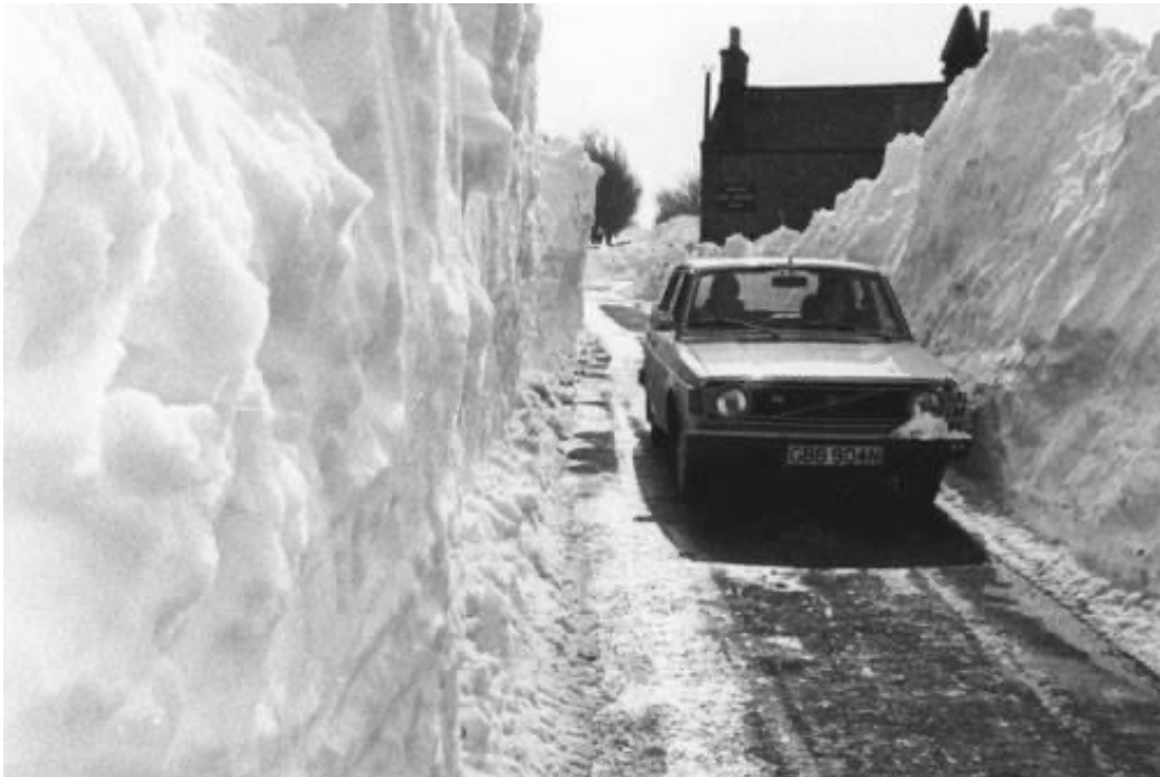
Hoge Sneebargen op de Straten in Noorrdüütschland